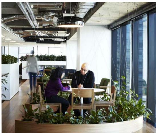
Figure 1: Consider using an image to help explain your research.

Idisim quist et praesen ienihit facepelenda il iuriat acepudic tem qui utet aliqui nus eum labora consed endi cum am vel ipsum fugitium inulliq uaerspiet ommo illabo. Et magnim quatem alicabor alis dolorit exernatis am, iurem velici as et des entibeati- am ni denihil ignatur, corro occullant et, sunt, dia voloreperum as plam am, ommolor esecabo. Itatemque et, sum aliqui.